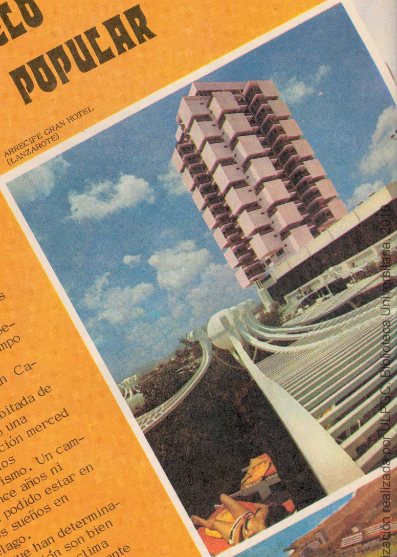
ARRECIFE GRAN HOTEL (LANZAROTE)

En los últimos tiempos las Islas Canarias han tenido un florecimiento turístico insospechado. En un espacio de tiempo relativamente muy corto, zonas y ciudades como Gran Canaria y las Palmas -la más habitada de las Canarias- han sufrido una profunda transformación merced a la influencia y a los beneficios del turismo. Un cambio que hace quince años ni siquiera habría podido estar en el mundo de los sueños en este archipiélago. Los factores que han determinado la transformación son bien conocidos. Junto a un clima templado y primaveral durante todo el año, han jugado un papel fundamental las bonitas playas, el hermoso paisaje del interior de las Islas y la tradicional hospitalidad canaria, reconocida y resaltada tantas veces por los visitantes. Y ha tenido una singular importancia este elemento humano y su voluntad de lograr el más elevado progreso, cristalizado en empresas como "Promociones Turísticas Canarias, S.A.", (PROTUCASA) actualmente una de las más destacadas en el turismo canario, hoy por hoy, el sector económico más importante del país. PROTUCASA surgió en una coyuntura muy importante para el desarrollo turístico canario, cuando comenzaba a producirse el "boom" del turismo, un fenómeno ya consustancial a la vida cotidiana de la población canaria. Dentro de esta etapa, PROTUCASA supo concebir desde un primer momento cual