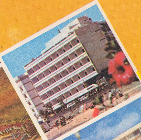
HOTEL LANCELOT (LANZAROTE)