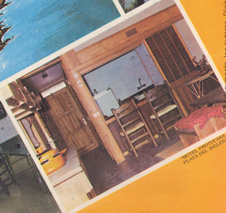
"HOTEL PROTUCASA PLAYA DEL INGLES"