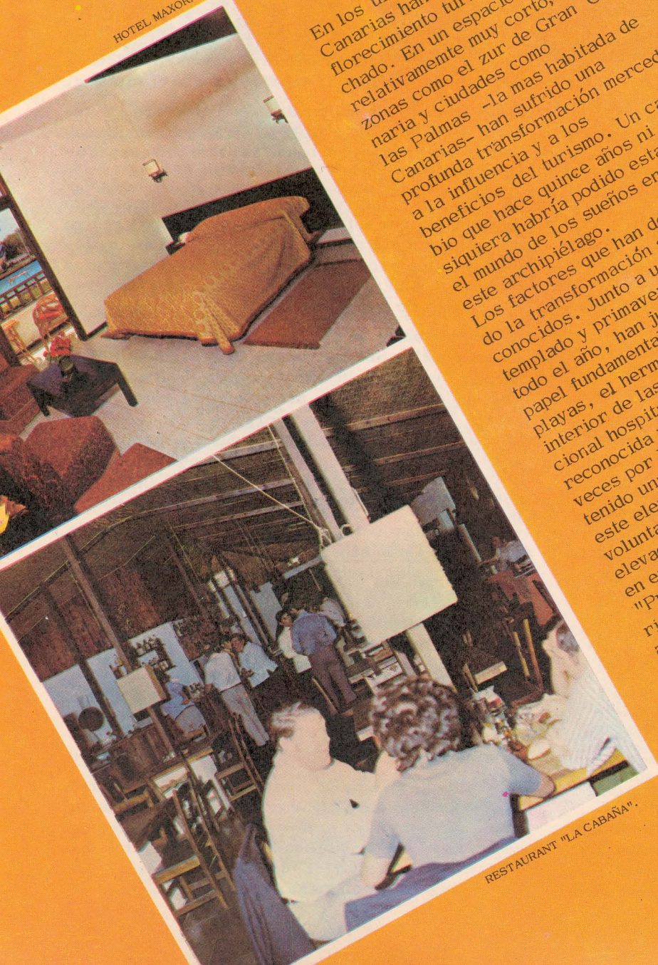
RESTAURANT "LA CABAÑA"

En los últimos tiempos las Islas Canarias han tenido un florecimiento turístico insospechado. En un espacio de tiempo relativamente muy corto, zonas y ciudades como Gran Canaria y las Palmas -la más habitada de las Canarias- han sufrido una profunda transformación merced a la influencia y a los beneficios del turismo. Un cambio que hace quince años ni siquiera habría podido estar en el mundo de los sueños en este archipiélago. Los factores que han determinado la transformación son bien conocidos. Junto a un clima templado y primaveral durante todo el año, han jugado un papel fundamental las bonitas playas, el hermoso paisaje del interior de las Islas y la tradicional hospitalidad canaria, reconocida y resaltada tantas veces por los visitantes. Y ha tenido una singular importancia este elemento humano y su voluntad de lograr el más elevado progreso, cristalizado en empresas como "Promociones Turísticas Canarias, S.A.", (PROTUCASA) actualmente una de las más destacadas en el turismo canario, hoy por hoy, el sector económico más importante del país. PROTUCASA surgió en una coyuntura muy importante para el desarrollo turístico canario, cuando comenzaba a producirse el "boom" del turismo, un fenómeno ya consustancial a la vida cotidiana de la población canaria. Dentro de esta etapa, PROTUCASA supo concebir desde un primer momento cual