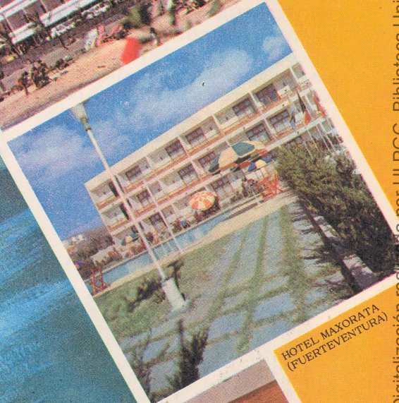
HOTEL MAXORATA (FUERTEVENTURA)