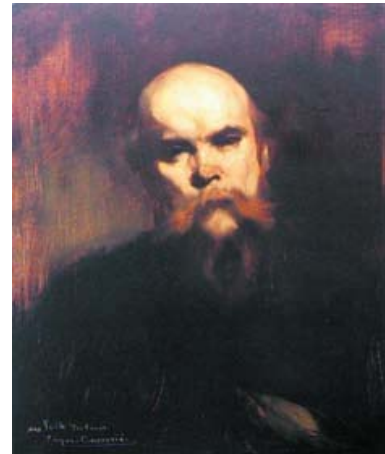
Retrato de Paul Verlaine

No ahondaré en esta ocasión en el capítulo entero que el nicaragüense le brinda a Rodin, pequeño ensayo en defensa del ingente escultor. Darío no llega a simpatizar plenamente con el expresionismo rodinesco, o sea, el Rodin más abstracto, macizo y convulso, pone a prueba su tolerancia modernista, a la vez que canta las glorias del